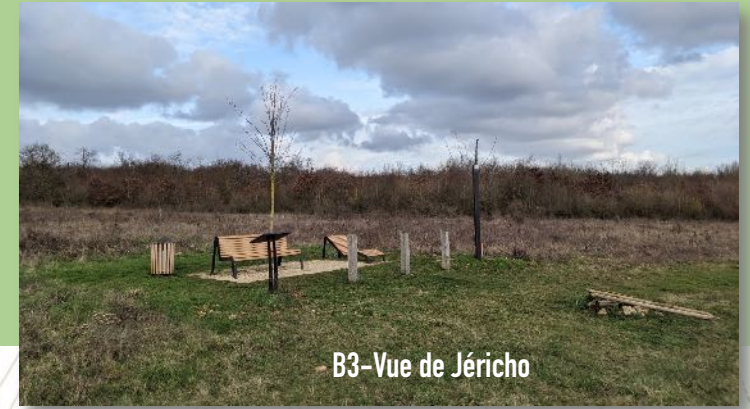
B3-Vue de Jéricho