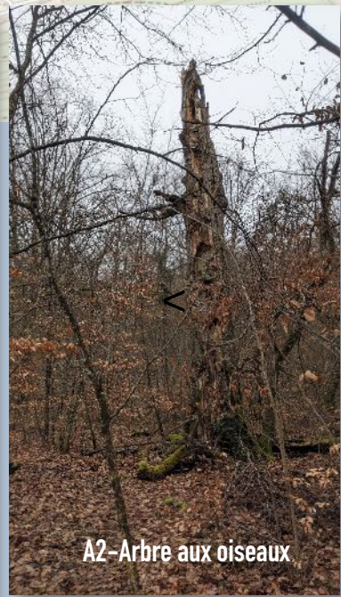
A2-Arbre aux oiseaux