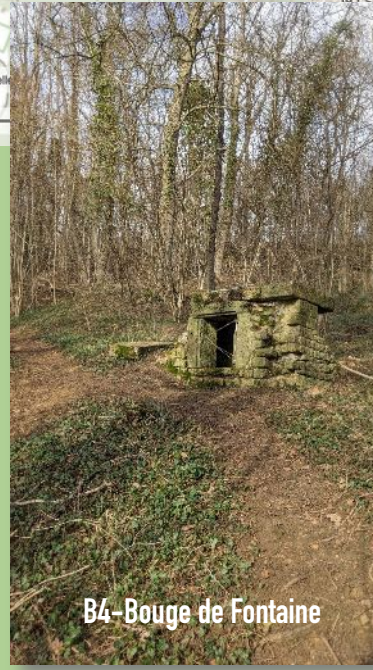
B4-Bouge de Fontaine