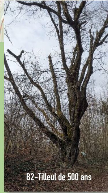
B2-Tilleul de 500 ans