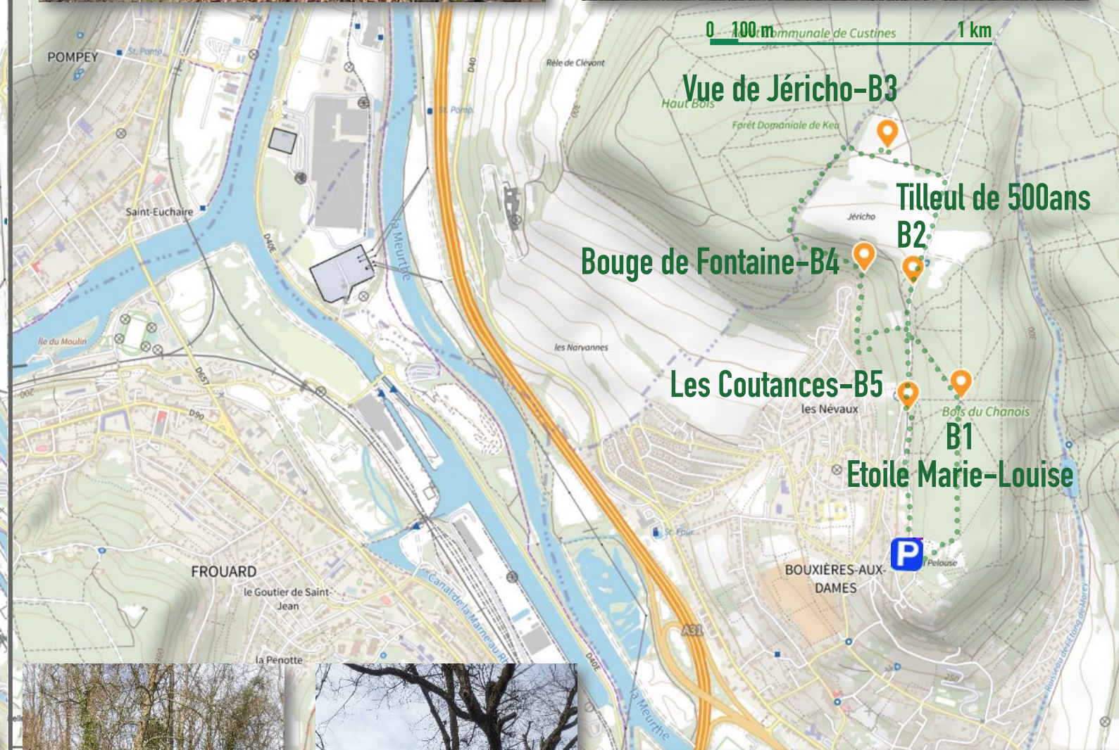
Vue de Jéricho-B3