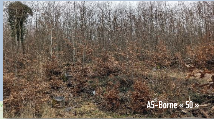
A5-Borne « 50 »