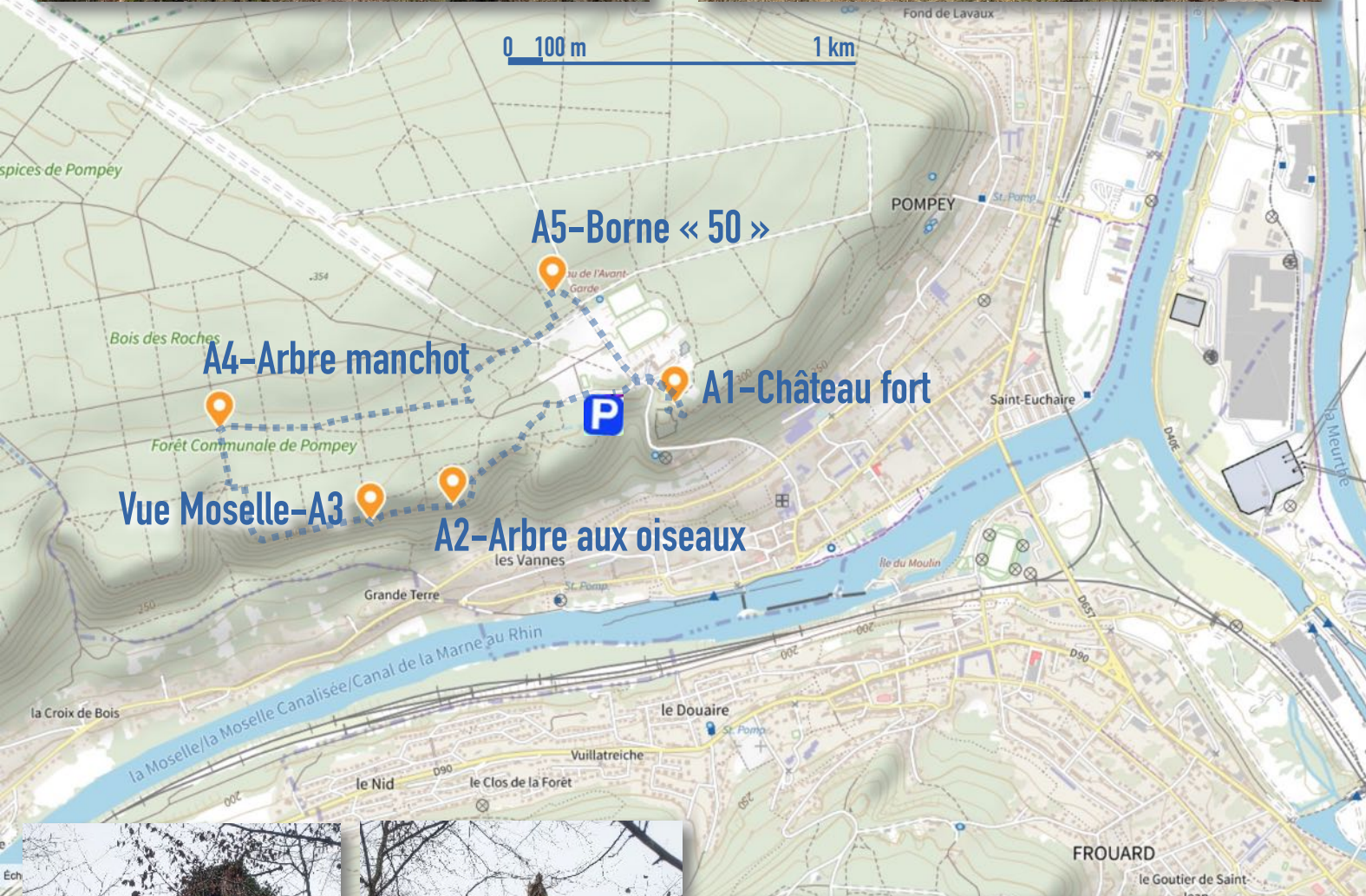
A5-Borne « 50 »